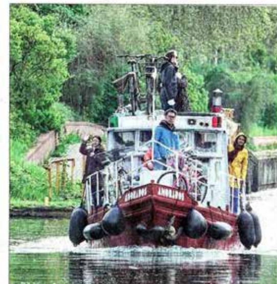
Le voyage devrait durer quatre mois et donner lieu à un spectacle qui sera présenté au TJP de Strasbourg.

« Le spectacle sera un voyage virtuel sur le Danube. Un voyage sensitif aussi car plusieurs sens vont être sollicités. Notre pari c'est que le spectateur se positionne du point de vue du